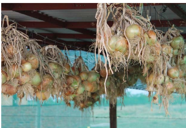
Løg var blevet høstet og hængt til tørre