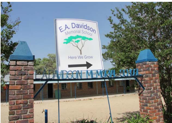
Nyt skilt er kommet op på skolen