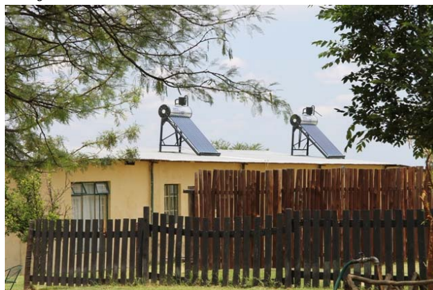
De 2 solvarmeanlæg