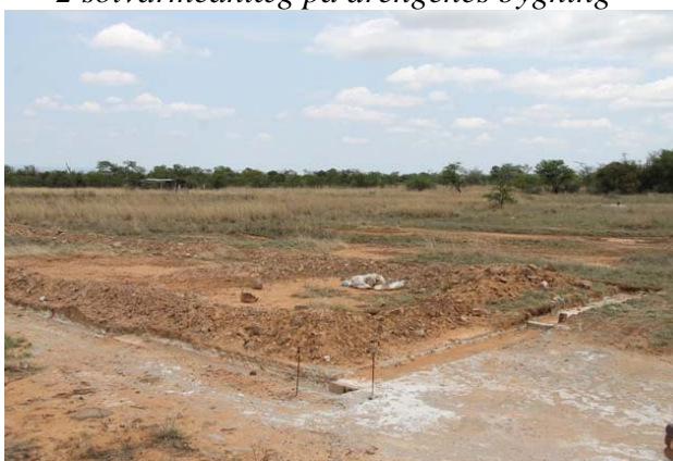
Fundament til Multihallen er under støbning