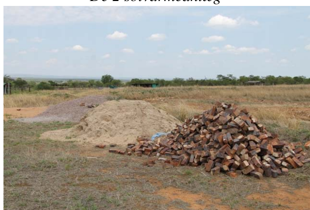
Og sand og mursten ligger klar