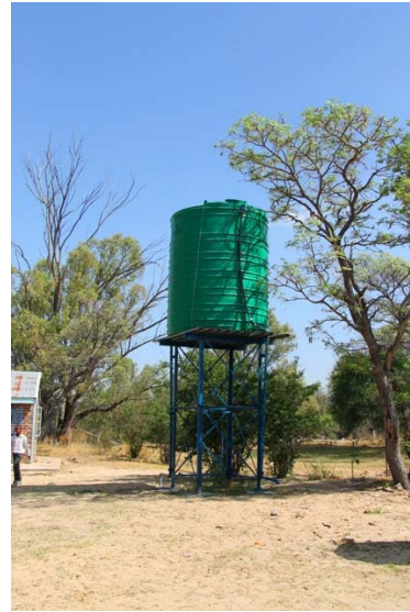
Vandboring og vandtank sikrer nu godt drikkevand til børnene