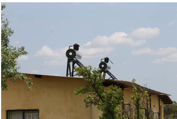
2 solvarmeanlæg på drengenes bygning