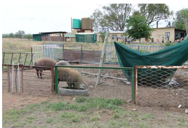
Et par søer fra den nye svinesti