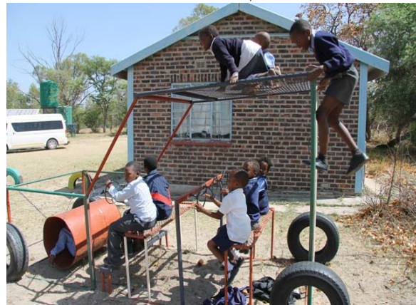
Der er gang i den nye legeplads