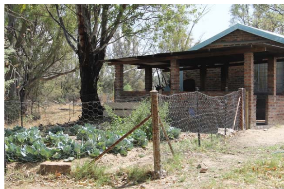
Skolekøkkenhave og skolekøkken