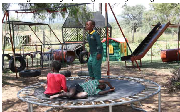
Legepladsen var flyttet hen i skyggen. Og den bliver brugt rigtig meget...