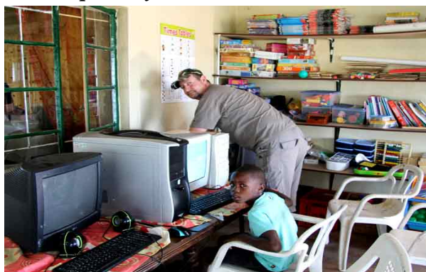
Computerne undersøges af frivillig dansk IT ekspert -og 3 af 10 computere kom op at køre