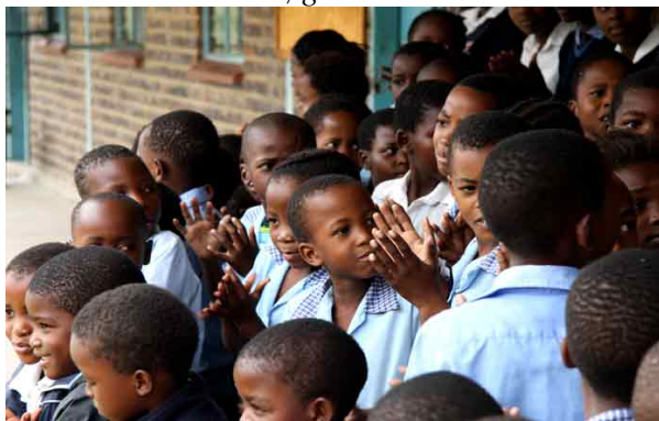
Børnene er glade og smilende, selv om skolen har problemer