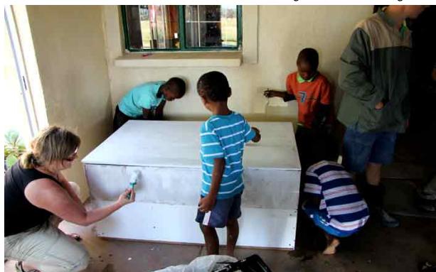
En legetøjskasse blev sammentømret og malet af børn og danske frivillige