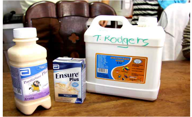
Der gives nu dagligt vitaminer og mineraler