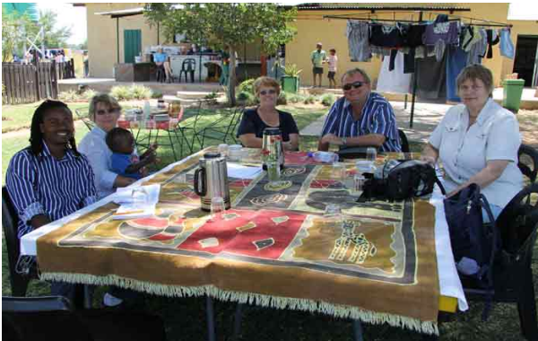
Afrikaskolen holder bestyrelsesmøde med Bushveld Mission i haven