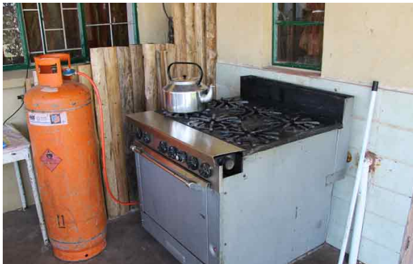
Børnehjemmet har fået et gaskomfur, da strøm er blevet meget dyrt.