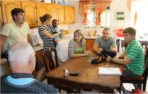
Vi taler med det unge management-teamet