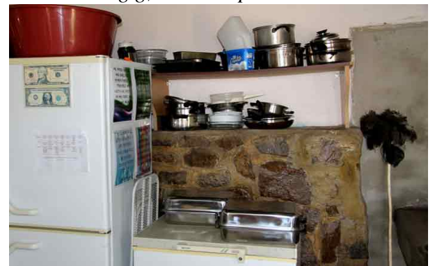
Der var blevet indkøbt diverse husgeråd til børnehjemmet