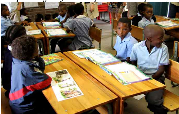
Børnene på Davidson-skolen har nu bøger i klasserne