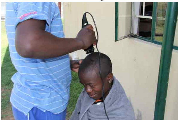
De store drenge læser til eksamen, men der var også tid til en hårklipning