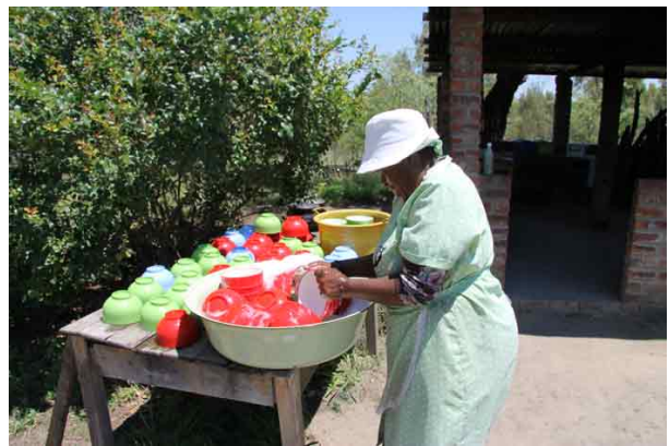
Bushveld Mission forsyner ofte skolen med skolefrokost