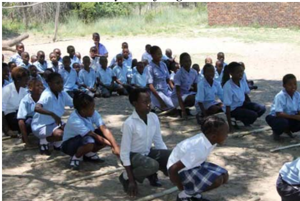
Børnene danser for os