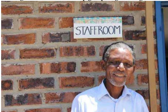
Kaizer var træt af det hele og går på pension til marts. ANC's system fungerer ikke, sir han.