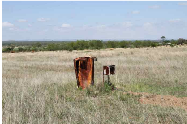
Vandboringen rækker slet ikke i tørtiden, så en supplerende boring står øverst på ønskesedlen