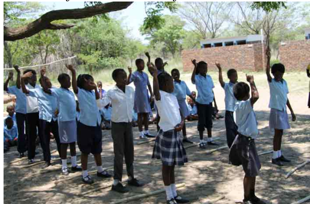
Nye danse, vi ikke har set før og som de har lært