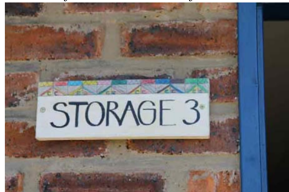
Der var ikke meget storage (oplag) i rummet med det fine skilt, lavet af en dansk volontør