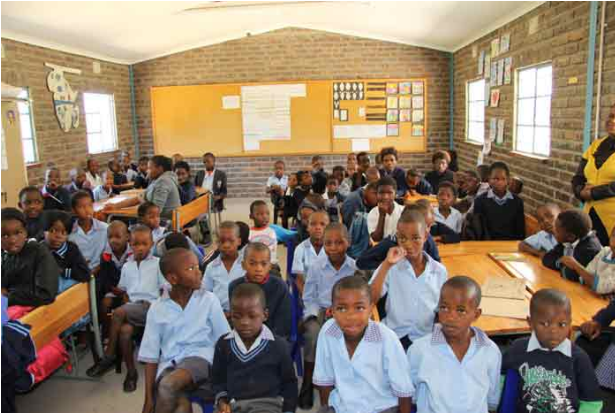
84 børn og 1 lærer. Ledige stillinger genbesættes ikke pga. pengemangel