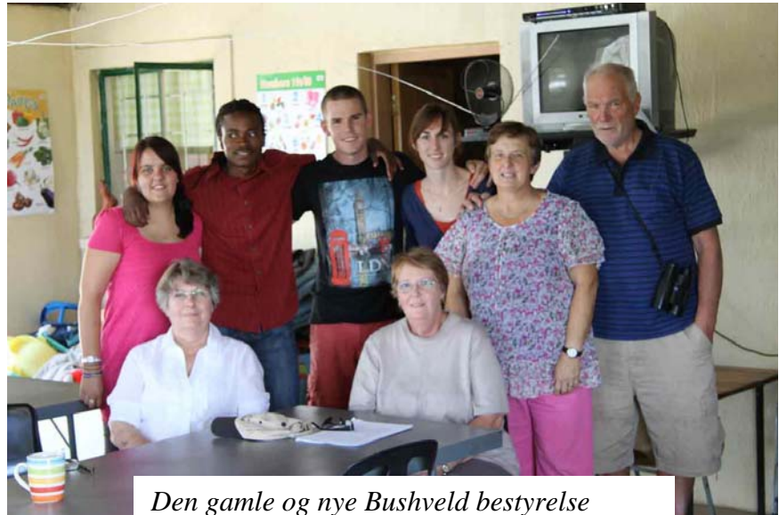
Den gamle og nye Bushveld bestyrelse