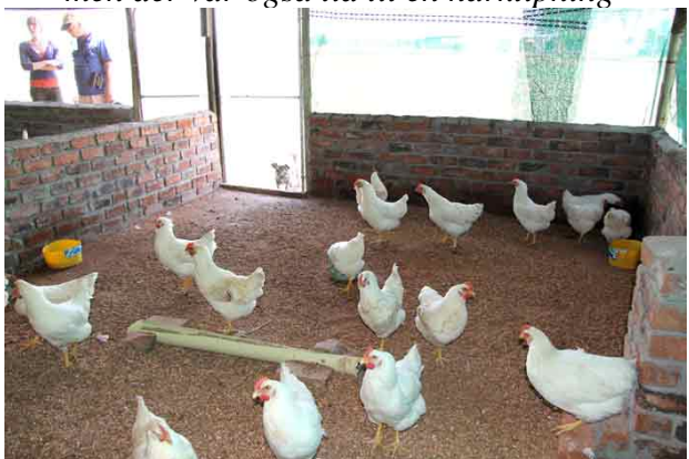
Børnehjemmet har fået mange høns, der giver børnehjemmet kød og æg