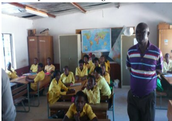
Denne klasse kunne udpege Danmark på kortet på bagvæggen