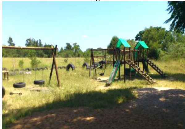
Legepladsen, som Afrikaskolen har sponsoreret