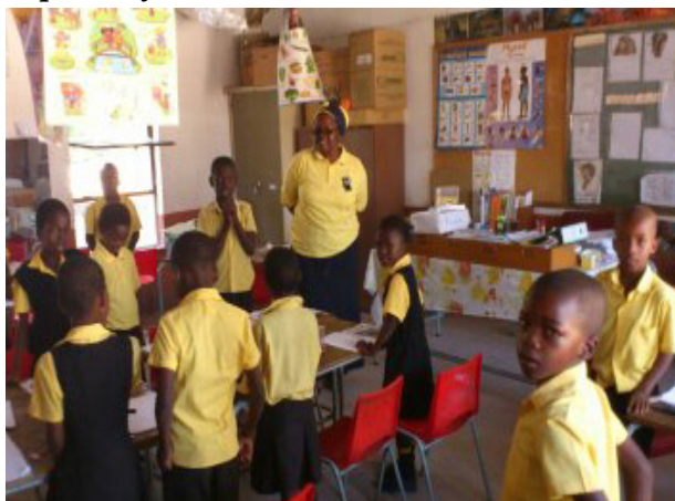
På Reathlahwa besøgte vi alle klasserne