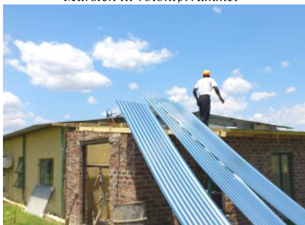
Plader til volontørrummets tag er på vej op