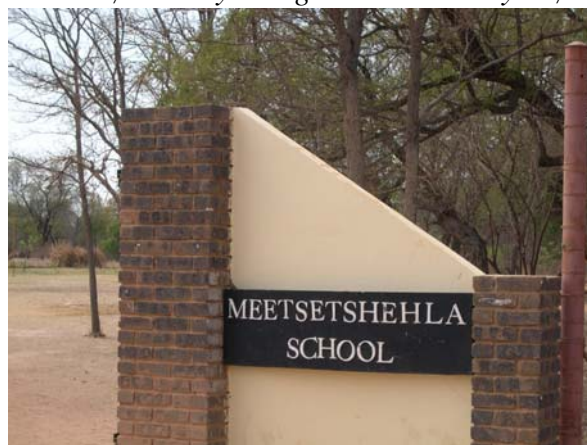
Indgangen til secondary school