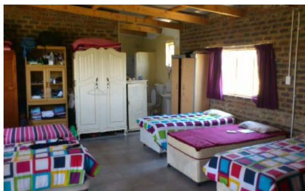
Der er købt 16 nye senge + linned til nye børn