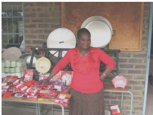
Skolerne fik som sædvanligt skolematerialer