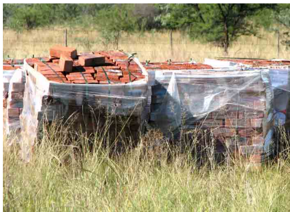
Mursten til volontørrummet