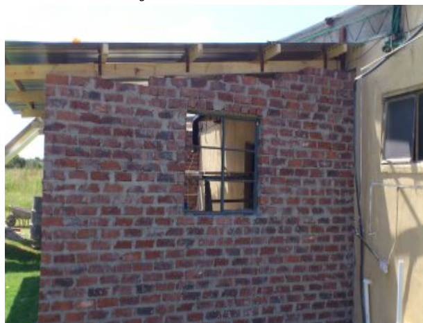
Murene er muret og et vindue sat i