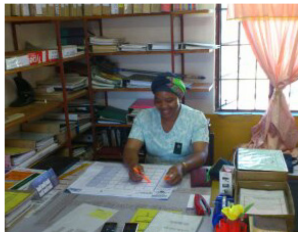
...og skolen har nu fået uddannet en kompetent leder til gavn for skole, medarbejdere og børn